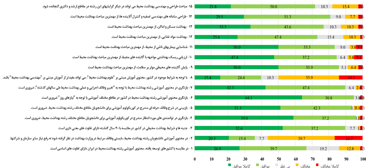
شکل ۳: نمایش درصد موافقت اساتید محترم بهداشت محیط کشور با سؤالات مطرح شده

محتوای آموزشی با اهداف خاص آن رشته، نه تنها می توان نقاط ضعف محتوایی را برطرف کرد، بلکه می توان باعث ایجاد تحولات اساسی در رشته های مختلف دانشگاهی شد. Karimi و همکاران (۲۰۱۴) در مطالعه ای برای بررسی چالش های آموزش عالی در تدوین محتوای برنامه ای درسی، با مشارکت ۱۵۳ عضو هیئت علمی که از طریق پرسشنامه انجام یافته است، به این نتایج دست یافتند که در تدوین محتوا با رویکرد جامعه ای یادگیری به ترتیب اولویت، رعایت معیارهایی مانند تأکید بر کیفیت محتوا به جای کمیت آن، ارائه ای محتوای منعطف و متنوع، تناسب محتوا با هدف پرورش یادگیرنده ای مادام العمر، تناسب محتوا با نیازهای جامعه، حمایت از استاد برای تغییر محتوا، استفاده از سایر منابع یادگیری در کنار کتاب درسی و مشارکت دادن دانشجو در انتخاب محتوا ضروری است. یافته ها حاکی از آن است که آموزش عالی کشور در رعایت این ملاحظات با چالش روبه روست [۳۲]. با عنایت به نتایج مطالعه ای فوق، می توان استنباط کرد که محتوای آموزشی دانشگاه ها در سطح کلان به بازننگری های اساسی نیاز دارد که با نتایج حاصل از مطالعه ای حاضر سازگار است. در مطالعه ای Nasr