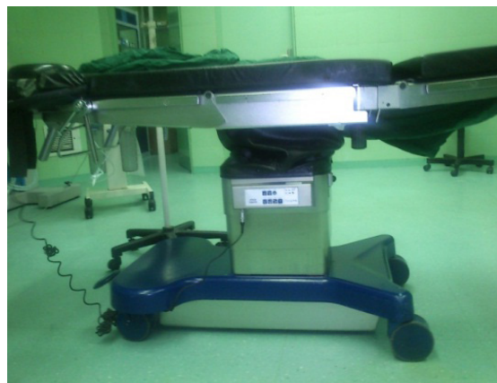
شکل ۱: تخت جراحی ارگونومیک در اتاق جراحی بیمارستان