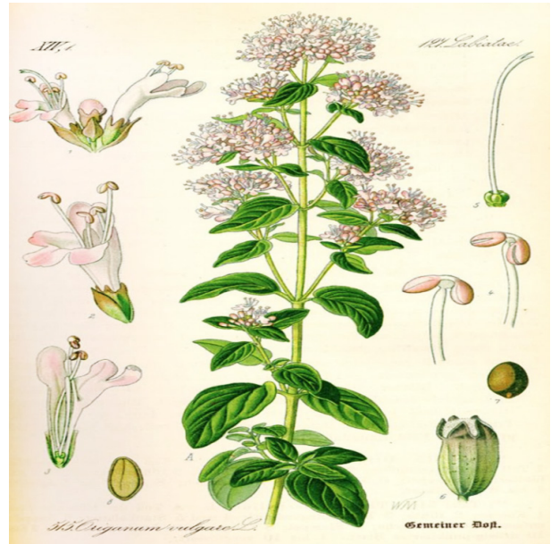
شکل ۱: نمای کلی اندام‌های گیاه مرزنجوش ( Origanum Vulgare L. )

تقطیر با بخار آب به دست می‌آید که زرد رنگ است. در هر بار اسانس گیری از ۱۰۰ گرم برگ‌های خشک شده گیاه مرزنجوش، تقریباً ۰/۸ تا ۱ میلی‌لیتر اسانس به دست می‌آید [۸]. به طور کلی، ترکیبات شیمیایی اسانس گیاه مرزنجوش بر حسب محل رویش و واریته‌های آن متفاوت است. در بسیاری از مطالعات، کارواکرول و تایمول به عنوان مهم‌ترین ترکیبات غالب اسانس این گیاه معرفی شده‌اند. کارواکرول بیشترین میزان (۴۶ تا ۸۸ درصد) تشکیل‌دهنده ترکیبات را در اسانس گیاه مرزنجوش داشته و این ترکیب به عنوان مهم‌ترین ترکیب اسانس این گیاه معرفی شده است؛ اگرچه در برخی از مطالعات، میزان کارواکرول در سطح پایین (۱۱ تا ۳۸ درصد) گزارش گردیده است [۹].