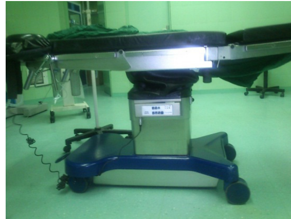
شکل ۱: تخت جراحی ارگونومیک در اتاق جراحی بیمارستان