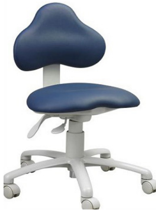
شکل ۲: نمونه صندلی ارگونومیک برای جراحان