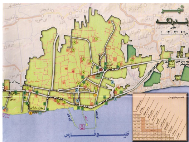
شکل ۱: موقعیت جغرافیایی شهر بندر لنگه

این مطالعه از نوع توصیفی-مقطعی بود. در مطالعه حاضر نمونه‌ها و اطلاعات در خصوص دیدگاه‌های مردمی با استفاده از پرسشنامه در سال ۱۳۹۳ و در شهر بندر لنگه، جمع‌آوری شد و علل گرایش آن‌ها به استفاده از دستگاه‌های آب شیرین‌کن خانگی مورد بررسی قرار گرفت. شهر بندر لنگه یکی از شهرهای استان هرمزگان در جنوب کشور ایران است که بالغ بر ۱۲۰ هزار نفر جمعیت دارد (شکل ۱). به علت موقعیت جغرافیایی و قرار گرفتن در ساحل خلیج فارس، وجود زمین‌های آهکی، گنبد‌های نمکی و کمبود بارندگی، فاقد آب شیرین به صورت جاری (نهر-رودخانه) و آب زیرزمینی (جهت حفر چاه و قنات) می‌باشد و تا شعاع ۱۵۰ کیلومتری آن، منابع آب شیرین وجود ندارد. در حال حاضر، انتقال آب توسط خط محرم صورت می‌گیرد که روزانه به طور متوسط مقدار ۹۰۰۰ متر مکعب آب وارد مخزن توزیع کننده شهر شده و پس از مخلوط شدن با آب تولیدی از دستگاه‌های آب شیرین‌کن خصوصی وارد شبکه توزیع شهری می‌گردد. دستگاه‌های آب