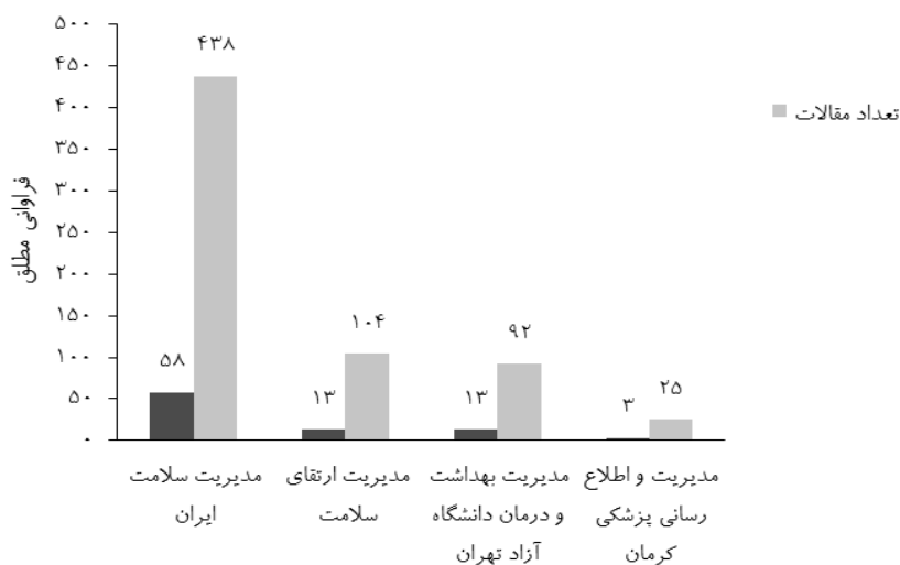
نمودار ۱: توزیع فراوانی تعداد شماره‌ها و مقالات مجلات حوزه مدیریت نظام سلامت از ابتدا تا پایان ۱۳۹۳

پردازش داده‌های حاصل از بررسی مقالات منتشرشده در چهار مجله و ۶۵۹ مقاله طی دوره زمانی یادشده، نشان داد که بیشترین مقالات چاپ‌شده مربوط به مجله مدیریت سلامت دانشگاه علوم پزشکی ایران با ۵۸ شماره و ۴۳۸ مقاله بود. اطلاعات بیشتر در خصوص تعداد شماره‌ها و مقالات منتشرشده