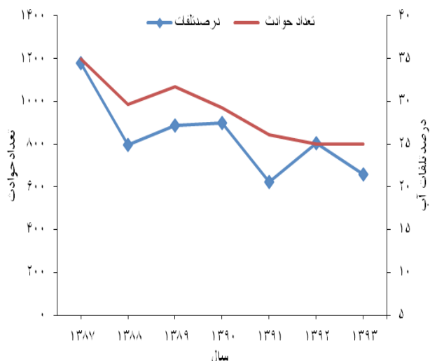
نمودار ۳: درصد تلفات و تعداد حوادث شبکه توزیع آب شهر ازنا طی سال‌های ۱۳۸۷-۱۳۹۳